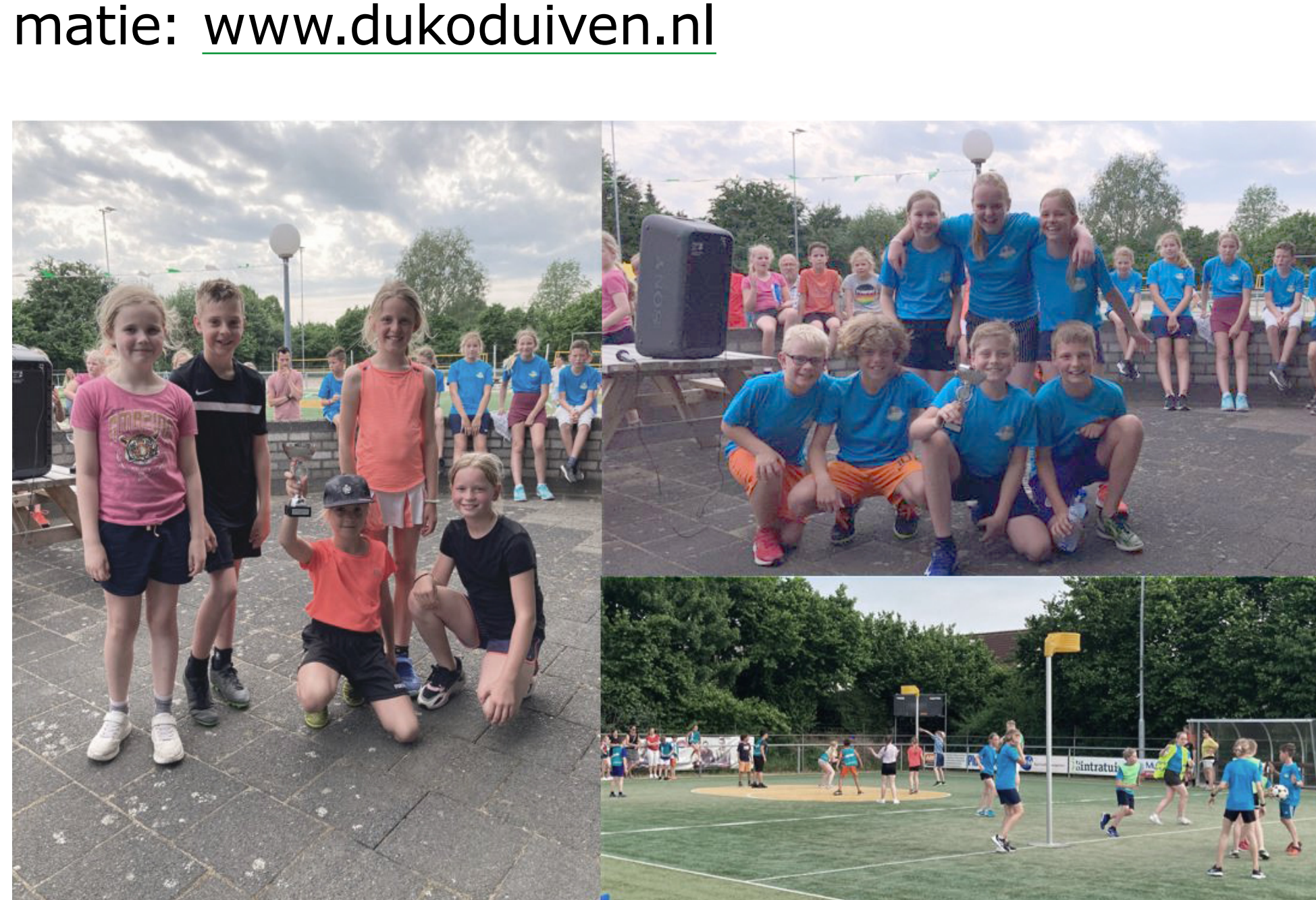
Links: winnaars groep 5/6 van Het Klokhuis, rechtsboven: winnaars groep 7/8 van de Kameleon.

Ook interesse om eens te komen kijken of korfbal iets voor jou of uw (klein)kinderen is? Wij trainen op dinsdag en vrijdagavonden. Voor meer informatie: www.dukoduiven.nl